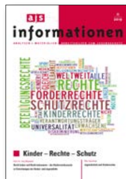
ajs-informationen 2/2019 Kinder – Rechte – Schutz